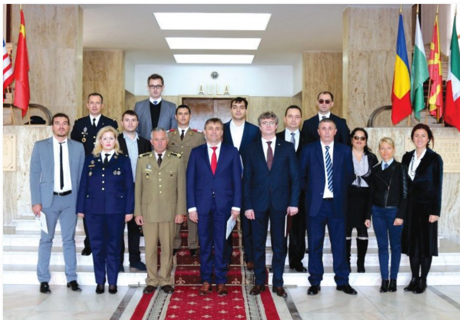
Sesiunea extraordinară comună a Comisiei Naționale de Drept Internațional Umanitar din România și a Comitetului Național Consultativ privind Coordonarea Aplicării Dreptului Internațional Umanitar din Republica Moldova (Ministerul Apărării Naționale – Universitatea Națională de Apărare „Carol I”, București, 13 octombrie 2016)