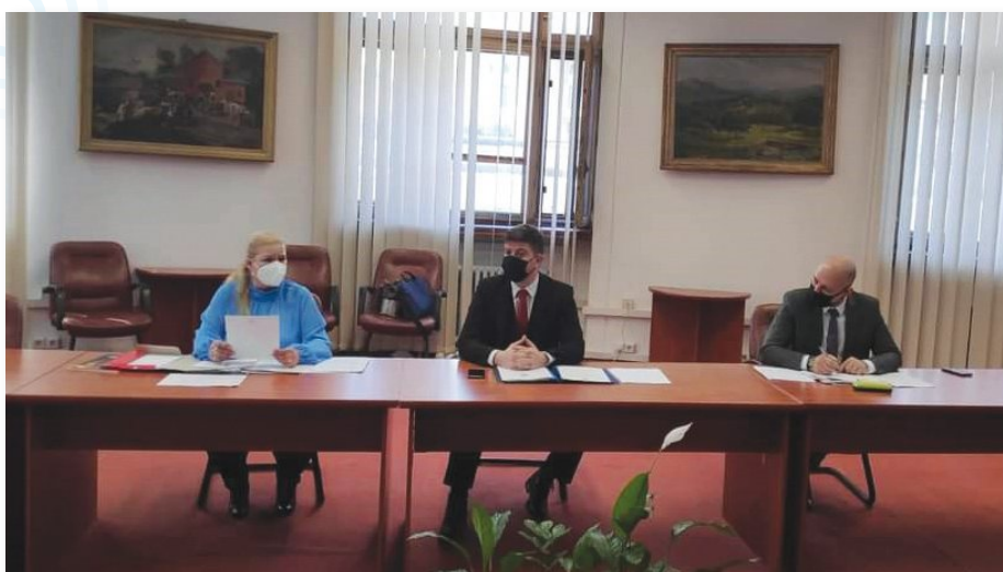
Sesiunea ordinară a Comisiei Naționale de Drept Internațional Umanitar (Ministerul Justiției, București, 05 martie 2021)