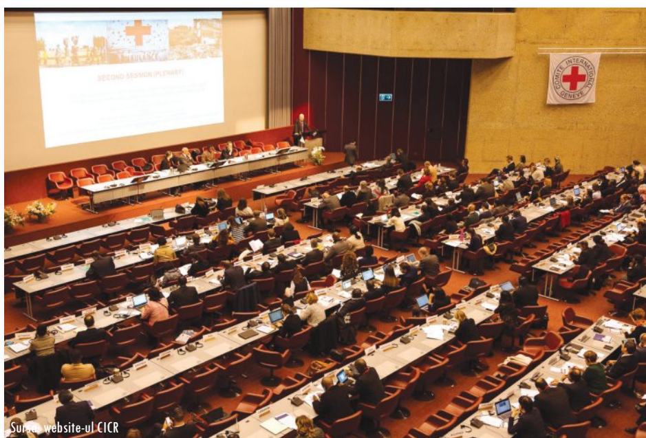
Participarea Comisiei Naționale de Drept Internațional Umanitar din România la reuniunea globală a comitetelor naționale și a organismelor similare de drept internațional umanitar, organizată de Comitetul Internațional al Crucii Roșii la Geneva în perioada 30 noiembrie – 2 decembrie 2016