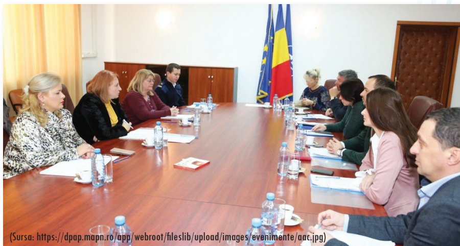
Sesiunea ordinară a Comisiei Naționale de Drept Internațional Umanitar (Ministerul Apărării Naționale, București, 19 decembrie 2019)