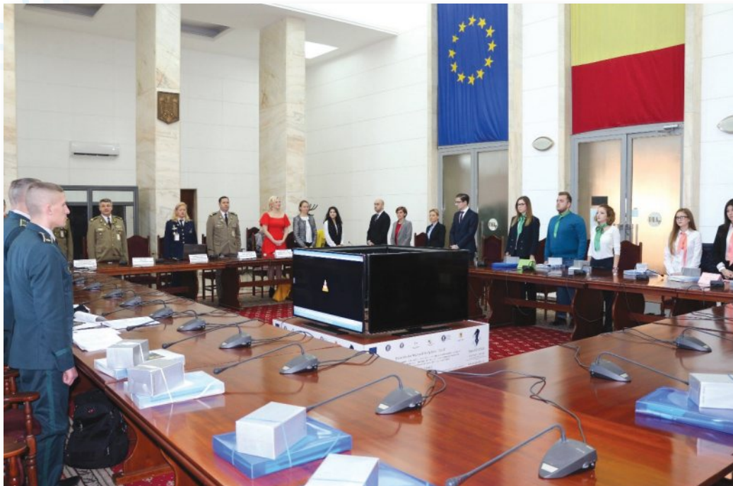
Concursul național interuniversitar de drept internațional umanitar și dreptul refugiaților „Nicolae Titulescu” (Universitatea Națională de Apărare „Carol I”, București, 8-10 decembrie 2017)