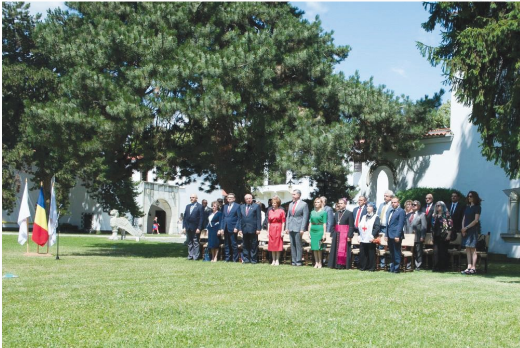
Membri ai Comisiei Naționale de Drept Internațional Umanitar la evenimentul dedicat Zilei Crucii Roșii române (4 iulie 2017), la invitația Majestății Sale Margareta, Custodele Coroanei Române, Președinta Societății Naționale de Cruce Roșie din România