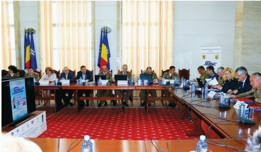
Eveniment dedicat aniversării Zilei Dreptului Internațional Umanitar (Universitatea Națională de Apărare „Carol I”, București, 14 mai 2017)