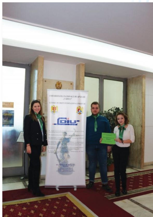
Câștigători ai Concursul național interuniversitar de drept internațional umanitar și dreptul refugiaților „Nicolae Titulescu” (Universitatea Națională de Apărare „Carol I”, București, 8-10 decembrie 2017)