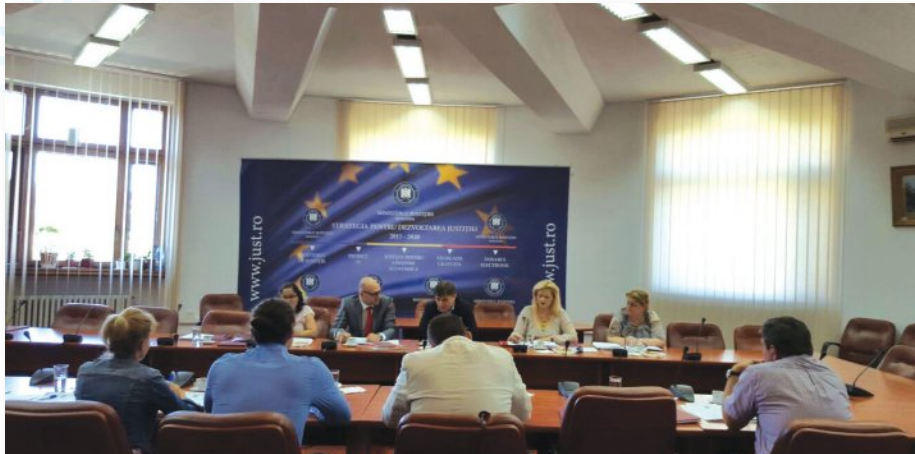
Sesiunea ordinară a Comisiei Naționale de Drept Internațional Umanitar (Ministerul Justiției, București, 16 iunie 2016)