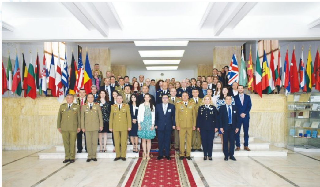
Eveniment dedicat aniversării Zilei Dreptului Internațional Umanitar (Universitatea Națională de Apărare „Carol I”, București, 14 mai 2018)