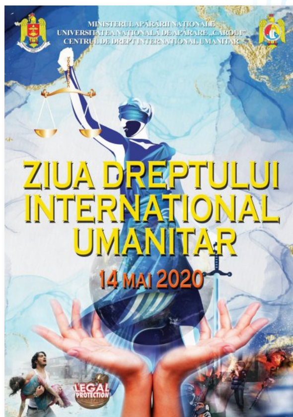
Afiș de marcare a Zilei Dreptului Internațional Umanitar – 14 mai 2020