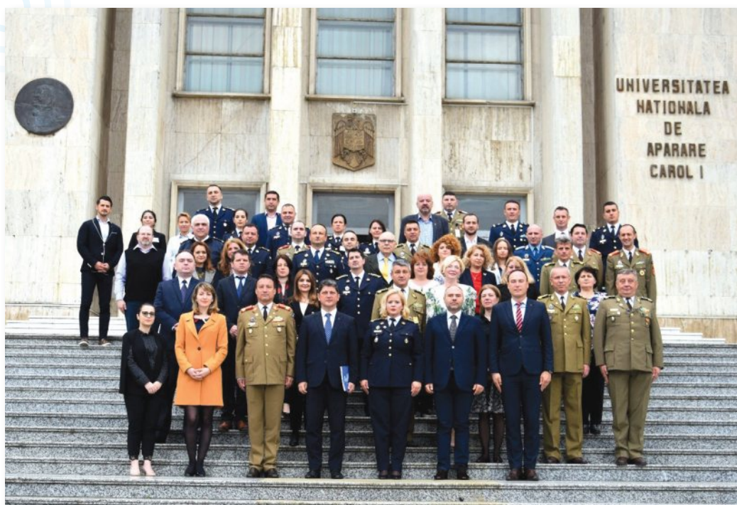
Eveniment dedicat aniversării Zilei Dreptului Internațional Umanitar (Universitatea Națională de Apărare „Carol I”, București, 14 mai 2019)