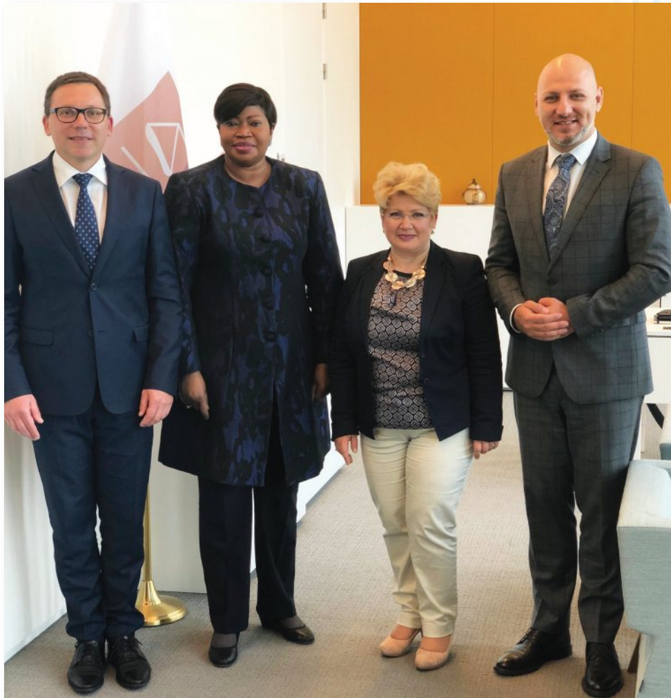
Conferința la nivel înalt cu ocazia „Zilei UE de luptă împotriva impunității pentru genocid, crime împotriva umanității și crime de război” (sediul Eurojust, Haga, 23 mai 2019), organizată de Președinția română a Consiliului UE, Comisia Europeană, Eurojust și Rețeaua pentru Genocid (De la stânga la dreapta: Președintele Eurojust Ladislav Hamran, Procurorul Curții Penale Internaționale Fatou Bensouda, Ambasadorul României în Regatul Țărilor de Jos, Brândușa Predescu, și reprezentantul Ministerului Justiției din România, Lorin Ovidiu Hagima.)